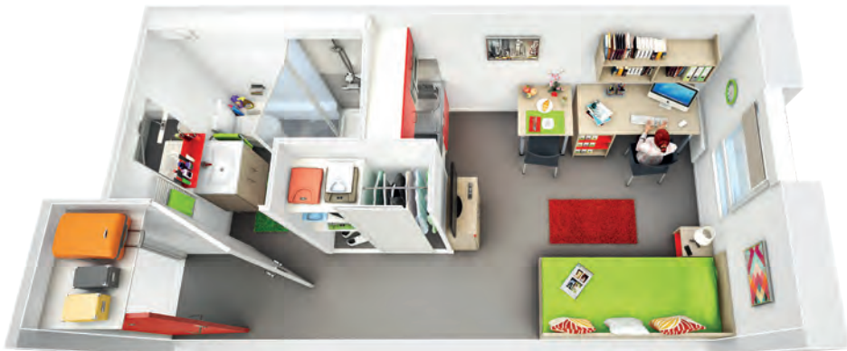
Exemple d'un studio 18 m 2 meublé (plan non contractuel)