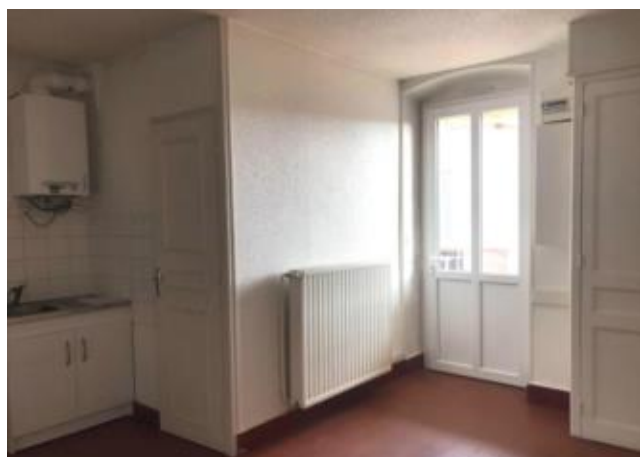
Réf.: 01343 Loyer mens.: 362€ CC* ROANNE

Appartement TYPE 2 de 46.34 M 2 au 1er étage, situé proche A.Thomas et hopital de Roanne, comprenant : cuisine avec balcon, séjour, 1 chambre, salle d'eau - Chauffage central individuel gaz.