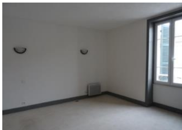
Réf.: 01244 Loyer mens.: 290€ CC* ROANNE

Appartement TYPE 2 de 47 M 2 situé 1er étage secteur Mulsant et comprenant : cuisine, séjour, 1 chambre, salle d'eau - 1 cabanon et 1 cave - Chauffage individuel électrique