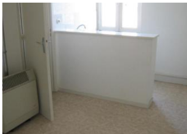
Réf.: 00566 Loyer mens.: 240€ CC* ROANNE

Studio de 19 m 2 au 2ème étage dans immeuble ancien, comprenant: une pièce à vivre avec kitchenette, une salle de bains - Chauffage individuel par radiateur Gaz.