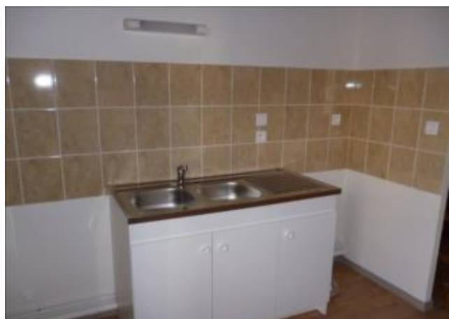
Réf.: 01220 Loyer mens.: 295€ CC* ROANNE

Idéal étudiant, appartement duplex TYPE 1 de 32.08 M2 au 1er étage d'un immeuble en hyper centre de Roanne et comprenant: cuisine ouverte sur séjour, 1 chambre, salle de bains avec wc - Chauffage individuel électrique.