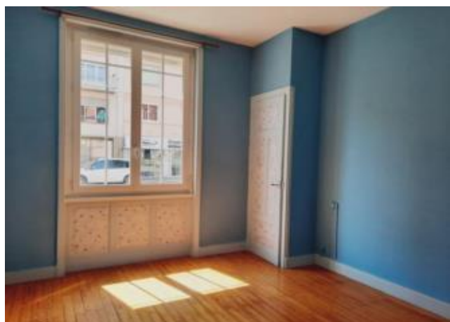
Réf.: 01869 Loyer mens.: 382€ CC* ROANNE

Appartement TYPE 3 de 60 M 2 situé au rez-de-chaussée dans résidence Avenue de Paris à Roanne, comprenant : cuisine, séjour, 2 chambres, salle de bains - 1 cave - Chauffage individuel gaz. Possibilité de gratuités de loyers contre travaux.