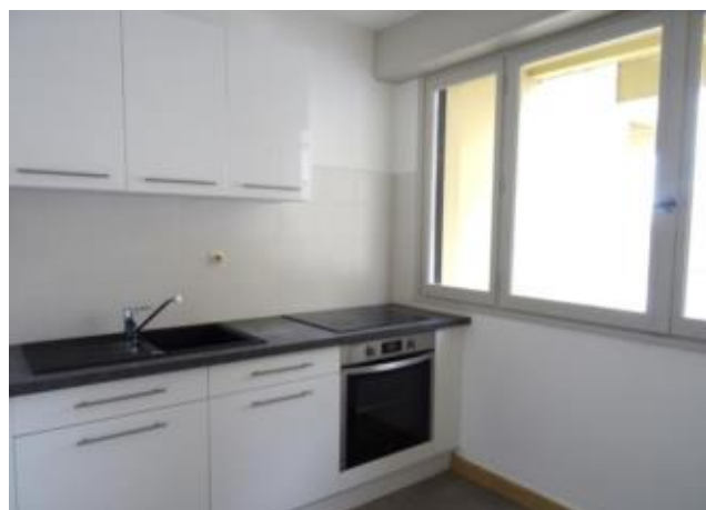
Réf.: 01879 Loyer mens.: 385€ CC* ROANNE

Appartement TYPE 1 NEUF de 35.67m 2 au 1er étage avec ascenseur, dans résidence calme proche gare de Roanne et comprenant : entrée, cuisine équipée, pièce de vie et salle d'eau - Chauffage collectif compris dans les charges.