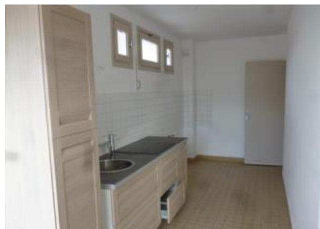
Réf.: 01408 Loyer mens.: 405€ CC* ROANNE

Appartement TYPE 2 de 53.06 M 2 situé au 3ème étage dans résidence proche gare et centre ville de Roanne, comprenant : cuisine équipée, séjour, dégagement avec placards, 1 chambre, salle d'eau - 1 cave - Chauffage individuel électrique - Possibilité place de parking en supplément à 40€/mois rue E.Noiret