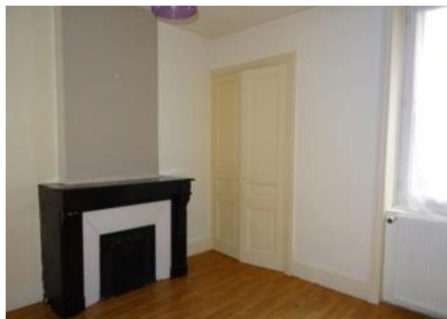
Réf.: 01491 Loyer mens.: 345€ CC* ROANNE

Appartement TYPE 2 de 46 M 2 situé au rez de chaussée, proche de la Place Victor Hugo de Roanne, comprenant : cuisine équipée, séjour, 1 chambre, salle d'eau - courette privative - Chauffage central individuel gaz -