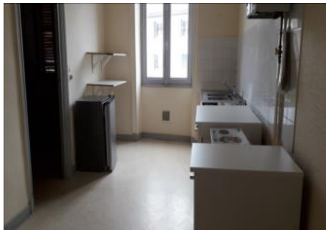
Réf.: 01061 Loyer mens.: 250€ CC* ROANNE

Appartement Type 1 de 30 M2, secteur hospital, 1er étage et comprenant: cuisine, pièce principale, salle d'eau - Chauffage individuel électrique -