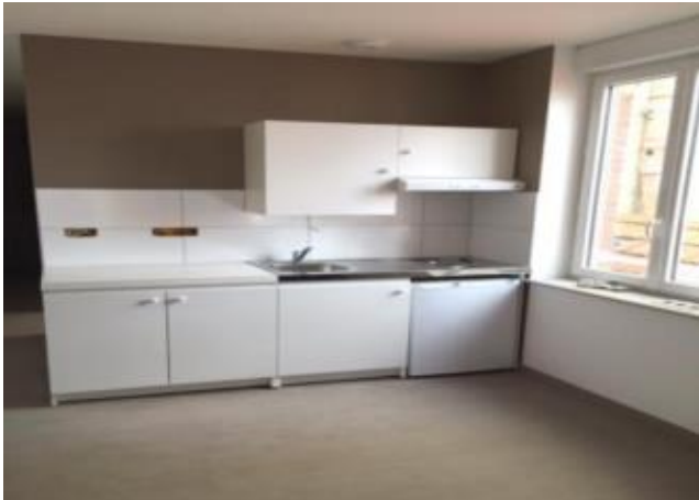
Réf.: 00583 Loyer mens.: 335€ CC* ROANNE

Idéalement situé, studio de 37.54 M 2 situé au 1er étage d'un immeuble place Clémenceau à Roanne, comprenant : cuisine meublée équipée ouverte sur pièce principale, salle d'eau - Terrasse privative - Chauffage individuel électrique