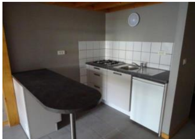
Réf.: 01149 Loyer mens.: 338,11€ CC* ROANNE

Appartement TYPE 1 BIS de 49 M 2 situé en rez-de-chaussée, proximité centre universitaire à Roanne et comprenant : cuisine équipée ouverte sur séjour, mezzanine, salle d'eau - Chauffage individuel central Gaz - Appartement conventionné