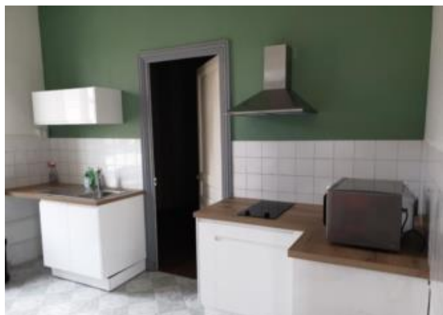
Réf.: 01716 Loyer mens.: 380€ CC* ROANNE

Appartement TYPE 2 de 43.19 m 2 au 1er étage d'un petit immeuble calme proche A.Thomas et hopital de Roanne : cuisine équipée, séjour, 1 chambre, salle d'eau - 1 cabanon - Chauffage individuel central Gaz