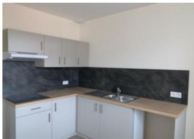
Réf.: 01651 Loyer mens.: 465€ CC* ROANNE

Appartement TYPE 2 de 58.17 M 2 , au centre ville de Roanne au 4ème étage avec ascenseur, et comprenant : cuisine équipée ouverte sur séjour, une chambre, salle d'eau - Chauffage individuel électrique.