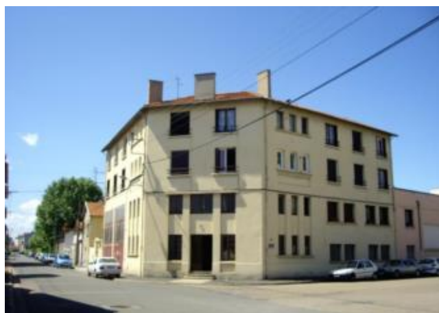
Réf.: 01832 Loyer mens.: 335€ CC* ROANNE

Appartement TYPE 2 de 37 M 2 situé au 3ème étage d'un immeuble secteur Hopital de Roanne et comprenant : cuisine, séjour, 1 chambre, salle d'eau - Chauffage individuel central Gaz