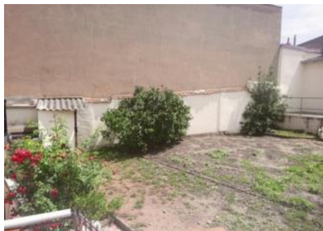
Réf.: 01804 Loyer mens.: 308€ CC* ROANNE

Appartement TYPE 1 BIS de 33.40 M 2 situé au rez-de-chaussée d'un petit immeuble, secteur Clermont à Roanne, comprenant : cuisine/séjour, 1 chambre, salle d'eau et jardin - Chauffage individuel central Gaz