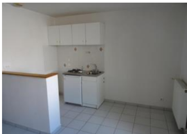
Réf.: 01650 Loyer mens.: 243,08€ CC* ROANNE

Appartement TYPE 1 BIS de 30 M 2 situé au rez-de-chaussée sur cour, secteur Clermont à Roanne et comprenant : cuisine aménagée, pièce de vie avec coin chambre, salle d'eau - Chauffage individuel Gaz - Appartement conventionné APL