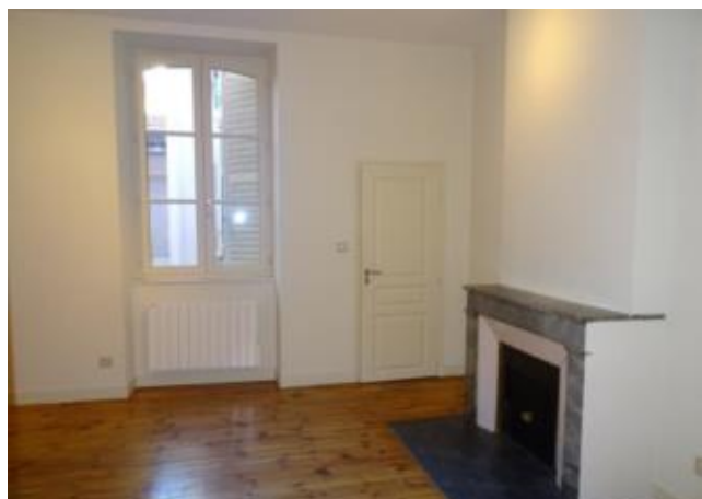
Réf.: 01850 Loyer mens.: 340€ CC* ROANNE

Studio de 35.39 M 2 situé au 1er étage d'un immeuble au coeur de la rue piétonne à Roanne, comprenant : pièce à vivre avec dressing, cuisine meublée, salle d'eau - Chauffage individuel électrique