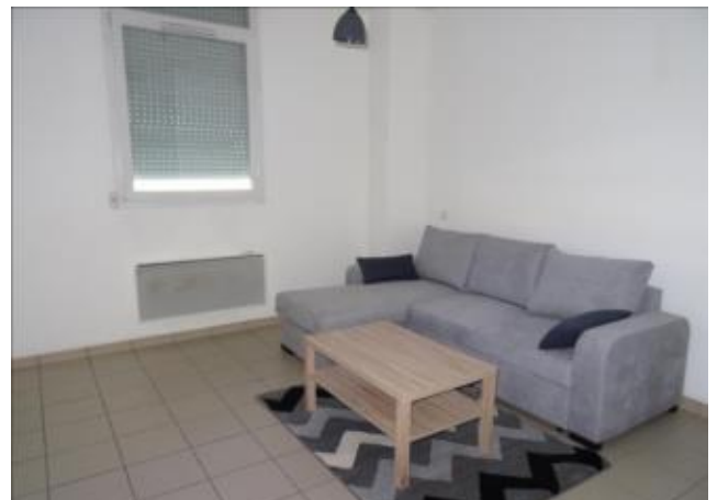
Réf.: 00840 Loyer mens.: 305€ CC* ROANNE

Studio meublé de 33.99 M 2 situé en rez-de-chaussée rue Marceau, proche gare de Roanne et comprenant : cuisine kitchenette ouverte sur séjour/chambre, salle d'eau et un WC - 1 cave - Chauffage individuel par convecteurs électriques.