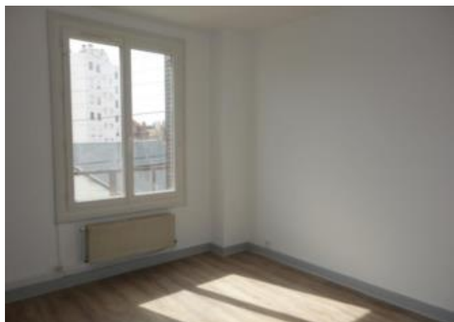
Réf.: 01433 Loyer mens.: 385€ CC* ROANNE

Appartement TYPE 2 de 50 M 2 , 2ème étage, proche hospital de Roanne comprenant : cuisine meublée, séjour, 1 chambre, salle d'eau - Chauffage individuel central gaz.