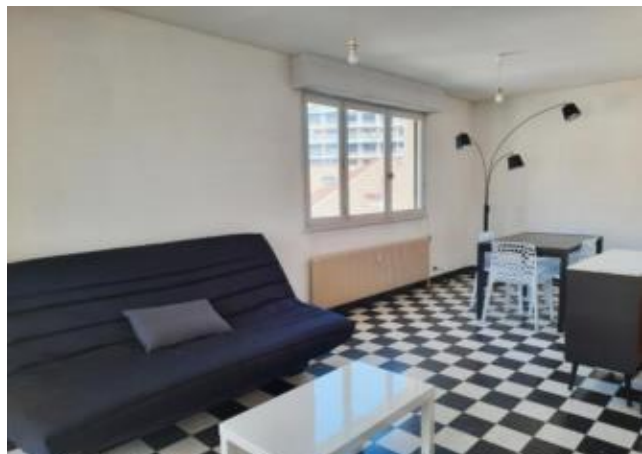
Réf.: 01912 Loyer mens.: 405€ CC* ROANNE

Appartement TYPE 1 meublé de 35.81 M 2 situé au 2eme étage dans résidence avec ascenseur, proche centre universitaire et gare de Roanne, comprenant : cuisine équipée, pièce à vivre avec balcon, salle d'eau - 1 cave - Chauffage collectif inclus dans les charges