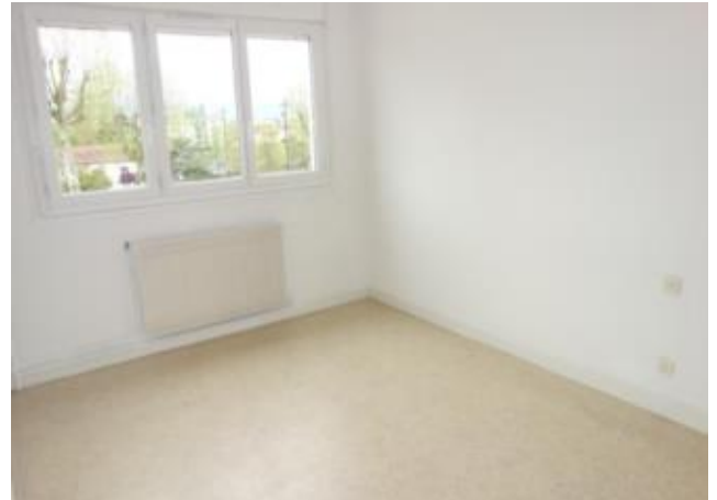
Réf.: 00617 Loyer mens.: 480€ CC* LE COTEAU

Appartement TYPE 2 de 49 M 2 situé au 2ème étage d'une résidence idéalement située avec ascenseur, proche gare et toutes commodités, Le Coteau comprenant : entrée, séjour, cuisine, 1 chambre, salle d'eau - Chauffage collectif inclus dans les charges. FRAIS D'AGENCE OFFERT POUR LES ETUDIANTS.