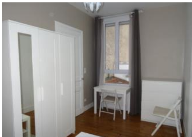
Réf.: 01305 Loyer mens.: 320€ CC* ROANNE

Studio meublé de 20 M 2 situé au 1er étage, proximité Albert Thomas et Hopital de Roanne, comprenant : entrée, cuisine équipée, 1 chambre, salle d'eau - 1 cabanon/buanderie - Chauffage individuel électrique