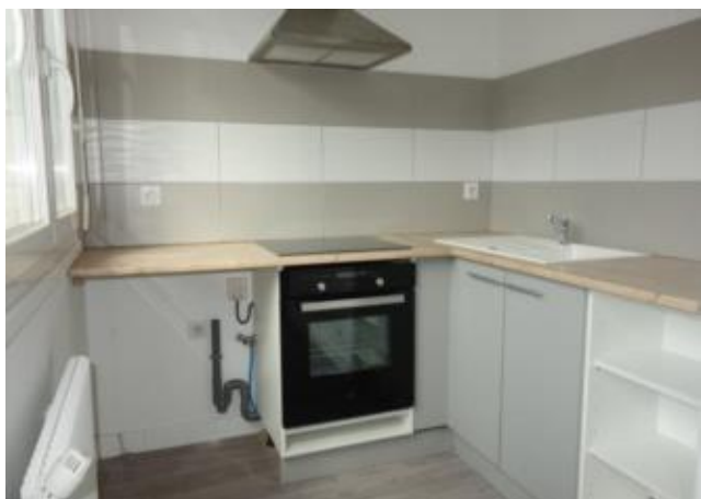
Réf.: 00379 Loyer mens.: 330€ CC* LE COTEAU

Studio NEUF de 30 M 2 situé au 1er étage situé dans résidence sécurisée, proche et gare et toutes commodités, Le Coteau comprenant : coin cuisine équipée ouvert sur pièce à vivre - salle d'eau - Double vitrage - 1 cave - Chauffage collectif - Possibilité de parking en sous sol. FRAIS D'AGENCE OFFERT POUR LES ETUDIANTS.