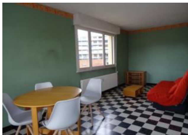
Réf.: 01848 Loyer mens.: 370€ CC* ROANNE

Appartement TYPE 1 équipé de 35.76m 2 au 3ème étage avec ascenseur, dans résidence calme proche gare de Roanne et comprenant : entrée, séjour, cuisine équipée, salle de bains, deux balcons et une cave. Chauffage collectif compris dans les charges.