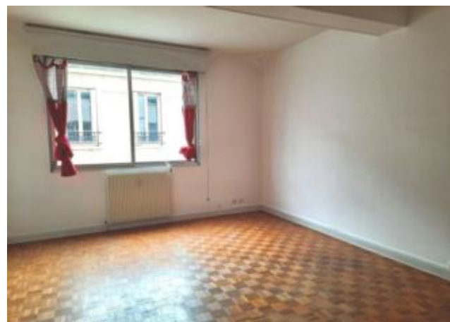
Réf.: 01313 Loyer mens.: 390€ CC* ROANNE

Appartement TYPE 1 de 32 M 2 situé au 1er étage dans une résidence bon standing en centre ville, comprenant : entrée avec placards, cuisine aménagée ouverte sur pièce de vie et salle d'eau - Chauffage collectif inclus dans les charges. Parking en sous-sol.