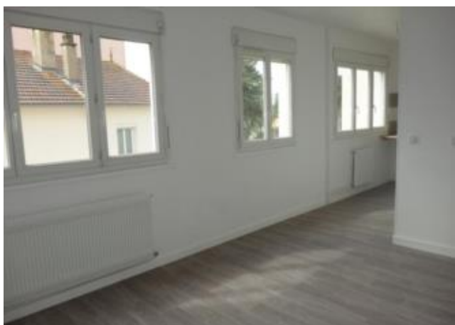
Réf.: 00529 Loyer mens.: 330€ CC* LE COTEAU

Studio NEUF de 29 M 2 situé au 3ème étage avec ascenseur dans résidence sécurisée face à la gare Le Coteau, comprenant : coin cuisine équipée ouvert sur pièce de vie, salle d'eau - Chauffage collectif inclus dans les charges - FRAIS D'AGENCE OFFERT POUR LES ETUDIANTS.