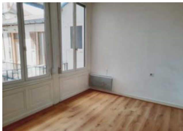
Réf.: 01862 Loyer mens.: 224€ CC* ROANNE

Appartement TYPE 1 de 23 M 2 situé au 1er étage, secteur gare de Roanne et comprenant : hall d'entrée, cuisine, pièce de vie et salle d'eau - Chauffage Individuel Electrique.