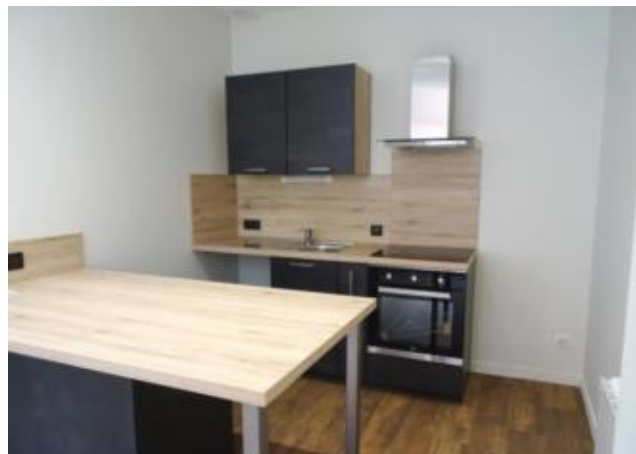
Réf.: 01916 Loyer mens.: 390€ CC* ROANNE

Appartement TYPE 1 NEUF de 42 M 2 situé au rez-de-chaussée, entre la gare et le centre ville de Roanne, comprenant : séjour avec coin cuisine équipée, 1 chambre, salle d'eau - Chauffage individuel électrique