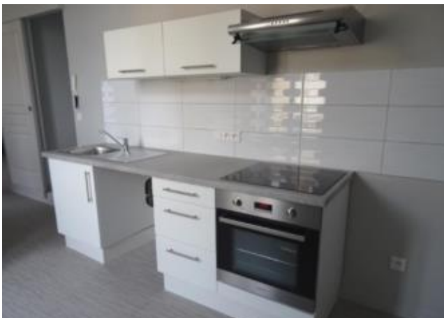
Réf.: 00839 Loyer mens.: 390€ CC* ROANNE

Appartement TYPE 2 de 60 M 2 situé au 2ème étage, proche place Victor Hugo à Roanne et comprenant : grande pièce de vie ouverte sur cuisine équipée, dégagement avec placards et WC séparé, 1 chambre, salle d'eau - un grenier - Chauffage individuel électrique